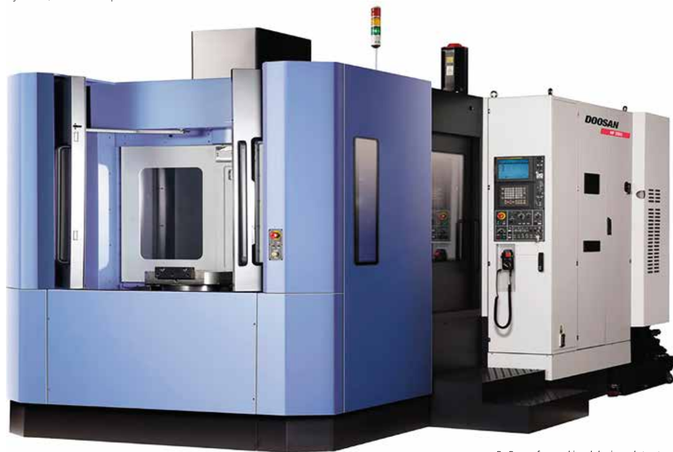
De Doosan-freesmachine als basis van het systeem.

Als Belgische bedrijven concurrentieel willen blijven, zijn flexibiliteit en continuïteit cruciaal. Haeck, al meer dan 20 jaar specialist in CNC-draaien en frezen voor derden, investeerde daarom in een nieuwe freesmachine met bijhorend palletsysteem, waardoor een automatische en snelle wissel van onderdelen mogelijk wordt. Deze installatie combineert een Doosan NPH 6300 freesmachine met een Fastems palletsysteem, een ontwerp van Germond.